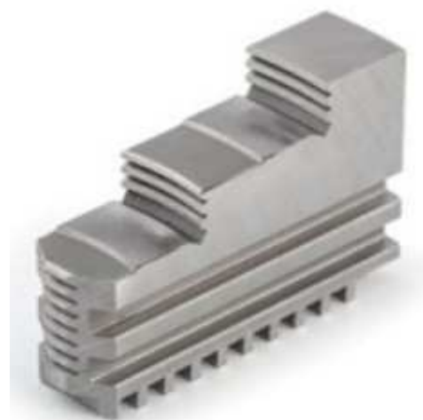
Griffe temperate ROVESCE