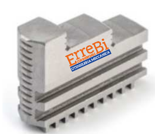
Griffe temperate DIRITTE